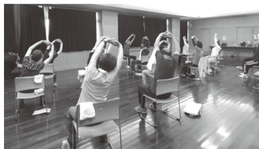
体を動かして介護予防!