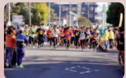
市内駅伝競走大会