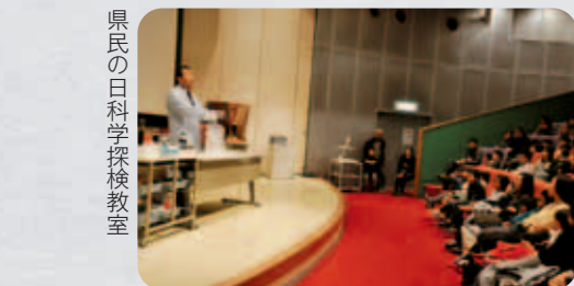
県民の日科学探検教室