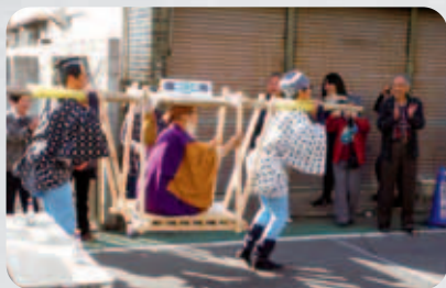
日光街道越ヶ谷宿場まつり