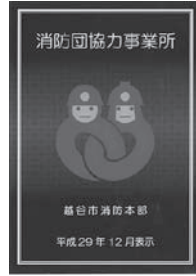
協力事業所表示証 (シルバーマーク)

消防団員を複数人雇用するなど消防団活動へ積極的に協力している事業所に対し、社会貢献の証として表示証を交付して