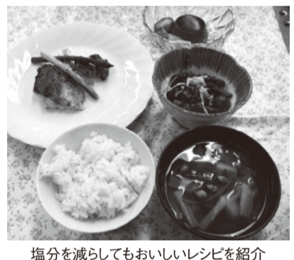
塩分を減らしてもおいしいレシピを紹介

◆越谷市歯科医師会学術部主催 市民向け学術講演会「最近、口の中が渇きませんか? ドライマウスと唾液の話」 口の中の唾液が不足して乾燥している状態をドライマウスと