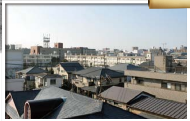
▶白い建物が現在の蒲生小学校。左端の白い建物は隣接する蒲生第二小学校