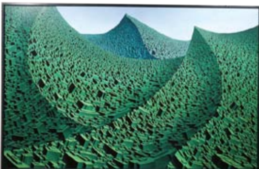
生命都市 一ねじれとゆがみー M150 キャンバス・油彩

私が最近製作している作品は、越谷で出会った桐材を使い、油絵具で仕上げた立体作品です。ヨーロッパやアメリカで発表していましたが、昨年4月に開催されたニューヨークアート・エキスポに出展する機会を得て、本格的な海外進出を果たすことができました。 28年前、私は結婚を機に、神奈川県川崎市から越谷市に引っ越ししてきました。初めて越谷市に来たときは、広がる田園と、なんともどかな静けさに「ホッ」としたことを覚えています。そんな越谷市も今ではすっかりにぎやかな街になり、なんと言ってもレイクタウンは県外からも多くの人が集まり、都市を感じる場所になっていっていると感じています。 このたびは、市制施行60周年おめでとうございます。私の住んでいる東越谷も空き地が少なくなるくらい住宅が増え、多くの子どもたちがにぎやかに登校しています。子どもたちに、安心安全なまちづくりを続けていくことが、市の豊かな財産となるのではないかと思います。