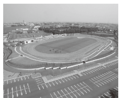
いらこばと運動競技場

については、利用者が安心して快適にスポーツ・レクリエーション活動を楽しめるよう、施設・設備の安全点検や計画的な改修を行うなど、環境整備に努めてまいります。また、全国レベルのスポーツ大会の誘致や、東京オリンピックの事前トレーニングキャンプ施設としての利用を促進するなど、幅広い活用を行ってまいります。