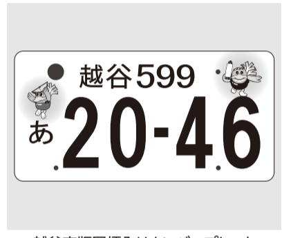
越谷市版図入りナンバープレート

また、公共施設については、安全・安心な公共施設等の総合的な管理を図るため、施設の将来のあり方を定めるアクションプランの策定に取り組んでまいります。