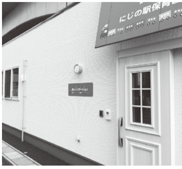
新設された保育ステーション

民間保育園、認定こども園及び地域型保育事業については、社会福祉法人等の施設整備を支援するなど、待機児童の解消に向けた定員の拡大に努めてまいります。また、特別支援保育については、引き続き公立保育所としての役割を果たすとともに、民間施設における特別支援保育の取り組みを積極的に推進してまいります。平成30年4月からは、越谷レイクタウン駅近傍に、3か所目となる保育ステーションを新たに開設するなど、多様な保育ニーズに応えるよう取り組んでまいります。