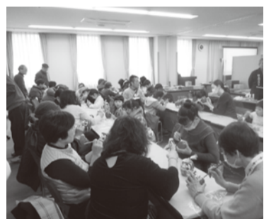
生涯学習フェスティバル (だるま絵付け体験)

生涯学習における主要な施策ですが、生涯学習活動については、多様化する市民の学習ニーズに的確に対応し、一人ひとりが主体的に学ぶことができるよう、市民との協働により、生涯学習フェスティバルやこしがや市民大学を企画・運営するほか、公民館における各種学級・講座を開催するとともに、学習機会の充実を努めてまいります。また、学習成果を地域社会やまちづくりの活かすことができるよう、生涯学習リーダー・ボランティア養成講座を開催し、人材育成の支援に取り組んでまいります。さらに、家庭の教育力の向上をはかるため、子育て講座や公民館における家庭教育学級を開催し、家庭教育の支援に努めてまいります。