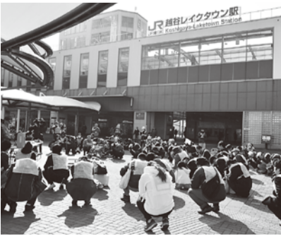
駅前で行われた帰宅困難者対策訓練

消防については、火災による被害を軽減するため、引き続き、住宅用火災警報器などの住宅用防災機器の普及・