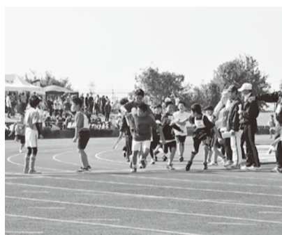
市民が参加する市民体育祭

生涯学習、スポーツ・レクリエーシ ョン活動については、市民の多様化す るニーズに的確に対応し、一人ひとりの 自己実現につながるよう、市民との 協働や関係機関との連携により、各種 大会、講座等を開催してまいります。