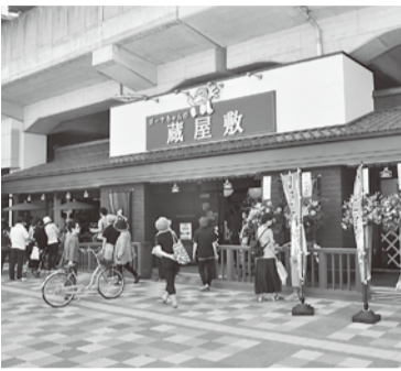
ガーヤちゃんの蔵屋敷敷

観光の推進については、一般社団法 人越谷市観光協会及び株式会社JT B 関東との連携強化を図り、花火大会や 田んぼアート事業などの観光イベント の開催を支援するとともに、大相模調 節池及び葛西用水ウッドデッキの水辺 を活用したにぎわいの創出に取り組ん でまいります。また、市の魅力発信に ついては、「こしがや愛されグルメ発信 信事業」を実施し、食を中心とした魅 力の掘り起こしに取り組むとともに、 「都市イメージ向上事業」を新たに立 ち上げ、地域での暮らしをテーマに多 彩な魅力を編集・発信し、ブランド力 の向上及び郷土愛の醸成を図ってま いります。さらに、東武スカイツリー ライン越谷駅東口高架下に整備した観光 物産拠点施設「ガーヤちゃんの蔵屋敷 敷」において、本市及び東武鉄道沿線 自治体等の魅力を発信するとともに、 徳島市並びに大船渡市、東松島市及び 名取市の東北被災地等との観光物産交 流を実施し、地方創生を踏まえた、集 客・送客・交流事業を展開してまいり ます。