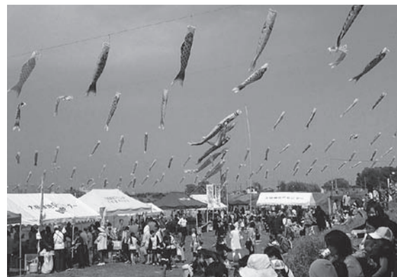
気持ちよさそうに泳ぐ約800匹のこいのぼり

〈内容〉 子ども向けのアトラクション、模擬店など。5月5日(土)まで元荒川で泳ぐたくさんのこいのぼりがご覧になれます