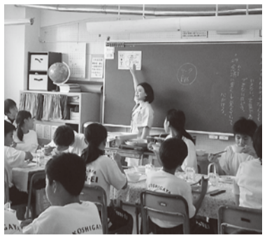
中学校で行われた食育の授業

学校給食については、ユネスコ無形文化遺産にも登録された「和食」を食育のテーマとし、献立に「郷土料理」を取り入れてまいります。また、「和食」を取り扱う3年間の食育計画を立て、1年目の取り組みとして食事の作法等を含めた「和食の基本」について