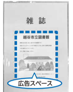
雑誌カバーの上などに広告を掲載できます

因市立図書館と市内各図書館(北部・南部・中央図書館)の新刊雑誌のカバーや書架扉に広告を掲載する、雑誌スポンサーを募集しています 因企業、商店、団体など 因申込書に広告案、企業等の概要が分かるものを添えて、直接市立図書館へ。申込書は市立図書館で配布するほか、市立図書館ホームページから印刷できます 因市立図書館 ☎965-2655 (月曜日休館)