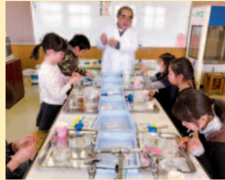
※日時・内容については一部変更になる場合があります。毎月発行の「ヒマワリだより」でご確認ください