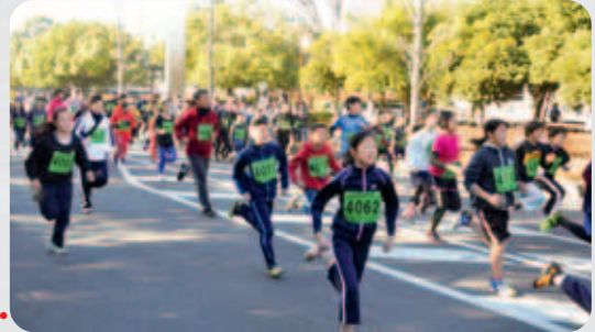
元旦マラソン大会