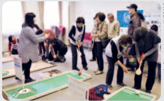
生涯学習フェスティバル