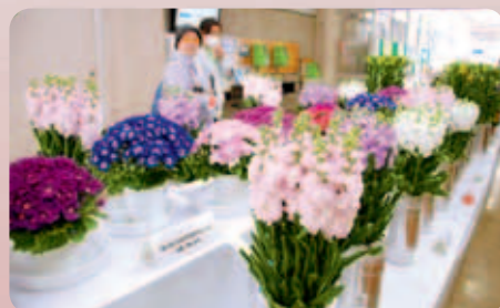
花の紹介コーナー

市制施行60周年記念事業の担当となり、1年7カ月の間、悪戦苦闘し、プレッシャーのかかる毎日でした。そんな状況の中、癒しといえば、娘の寝顔を見ることとラーメンを食べることぐらい。自分の限界を感じながらも、いろいろな方の温かい言葉やアドバイスが力になり、11月3日の記念式典とファイナルイベントが終わったときは、感慨無量でした。ただ終わって2、3日は、あの11月3日は夢じゃなかったのかと目が覚めては、カレンダーを見て、ほっとしていました。 ようやく今になって、達成感を感じプレジャーな毎日です。60周年にご協力いただいた皆さんに心から感謝を伝えたいです。ありがとうございました。（郷）