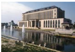
▲中央市民会館が開館(平成4年)