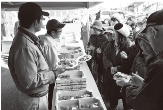
生産者が品種による味や食感の違いを説明しました

「紅ほっぺを購入した方は「フェアを目的に来ました。昨年、市内でイチゴ狩りをした時に酸味と甘みのバランスが気に入ったので紅ほっぺにしました」と話していました。また多くの人が、試食で味などの違いを確かめながら次々に購入していました。