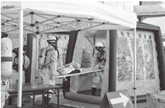
消防隊員が負傷者役の人を除染テントに運び除染しました

不審物を発見した駅職員が通報し、警察が人々の避難を誘導。防護服を着た消防隊員が消防車で駆けつけると、辺りは緊張した空気に包まれました。消防から要請を受けた災害派遣医療チームは、負傷者の救護活動を行い、災害発生時の一連の流れを確認しました。