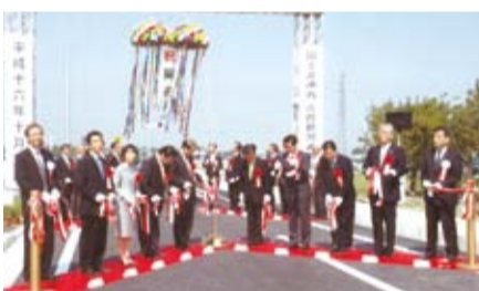
▲一部開通した国道4号東埼玉道路の開通式(平成16年)