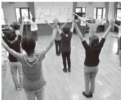
音楽に合わせて楽しく体を動かしてみませんか

●予防が大事! 「糖尿病講座」 時2月1日(木)、午前10時~11時 因糖尿病を予防する食生活 因10人 因受付中 ◎ハッポちゃん体操公開練習 健康づくりのためにあなたも 参加してみませんか。公開練習 に参加しポイントを貯めると、 ハッポちゃんグッズがもらえま す(数に限りがあります)。 場時①大沢地区センター...1月 10日(水) ②南越谷地区センター ...1月18日(水) いずれも午前10 時~11時30分 因飲み物、①は 室内用の運動靴 因当日会場へ