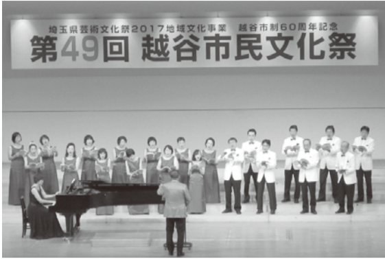
越谷市合唱協会の歌声は、観客を魅了しました

来場者は「すてきな作品ばかりで驚きました。これから私も何か始めてみたいと思います」と話し、じっくりと見入っていました。