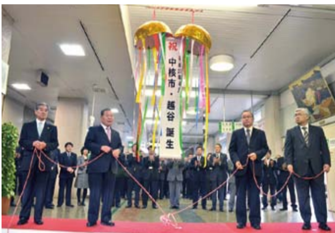
▲中核市移行式(平成27年)