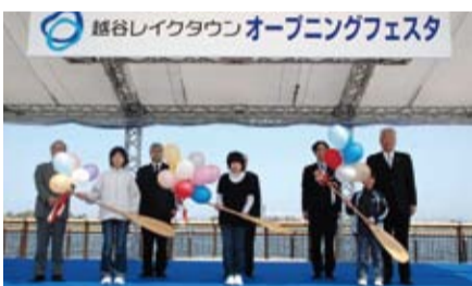
▲越谷レイクタウンオープニングフェスタ(平成20年)