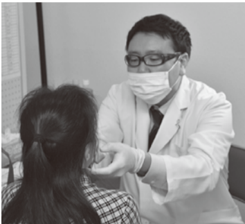
お口の悩みを相談できます

前9時～11時 因リハビリ(機能訓練の方法・腰痛予防・筋力向上など)について、理学療法士や作業療法士による個別相談 因受付中