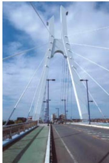
▲元荒川と葛西用水に架かるしらかばと橋が開通(平成6年)