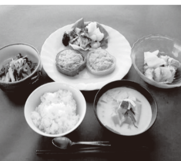
おいしく食べて健康になりましょう

時1月25日(木)、午前10時～午後1時 因講話と調理実習 因24人 費500円 因1月10日(水)から