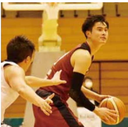
初めてユニフォームに越谷市のロゴを入れて臨んだ12月9日・10日のホームゲームで見事2連勝を飾りました