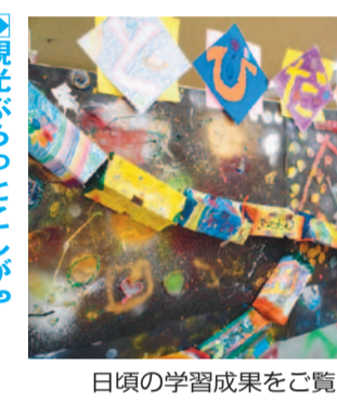
日頃の学習成果をご覧ください

【わくわく体験プロジェクト】 子どもが学校に行かないと言ったら 2月1日(日)、午前10時から 陽明センター市民会館5階第3会議室 円不登校に悩む方や実際に体験した方同士の交流 円不登校の方や保護者など30人 無料 即日会場へ 陽明センター ☎96339308