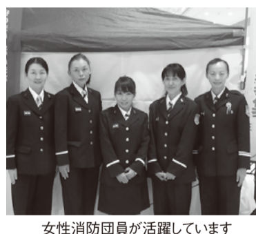
女性消防団員が活躍しています

◆女性消防団員募集 因防火広報活動・応急手当指 導など 因市内在住・在勤で 18歳~50歳の健康な方若干名 因1月4日(水)~31日(水)(消 印有効)(土曜・日曜日、祝 日を除く。午前8時30分~午 後5時)に、申込書を直接ま たは郵送で消防本部警防課 へ。募集要項・申込書は消防 本部警防課、消防署、各分署 で配布するほか、市ホーム ページから印刷できます 因 消防本部警防課(☎343-000 25 大沢2の10の15) ☎97 4-0104 ◆甲種防火管理新規講習会 一定人数以上を収容する建 物などは、防火管理者を届け 出る必要があります。 時2月6日(火)・7日(水)、午前 8時50分~午後5時(2日 間。7日は正午まで) 因消 防本庁舎4階多目的ホール 因市内在住・在勤・在学中、 防火管理者がいない建物など の管理・監督をする立場の方 70人 因3650円(テキスト ト代) 因1月23日(火)~30日 (土曜・日曜日を除く) に、受講申請書に必要事項を 記入し、費用と写真1枚(3 センチ×2.5センチ)を添えて、直 接消防本部警防課へ。受講申 請書は消防本部、消防署、各 分署の窓口で配布するほか、 市ホームページから印刷でき ます 因消防本部警防課 ☎9 74-0103