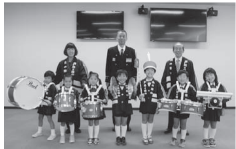
鼓笛隊セットは火災予防広報活動に活用されます

〔6面から続き〕 ◆埼玉県最低賃金の改定 平成29年10月1日から時間額871円に改定されました。特定の産業については別途特定(産業別)最低賃金が適用されます。詳しくは埼玉労働局賃金室または最寄りの労働基準監督署へお問い合わせください。 問 埼玉労働局賃金室 ☎048-600-6205