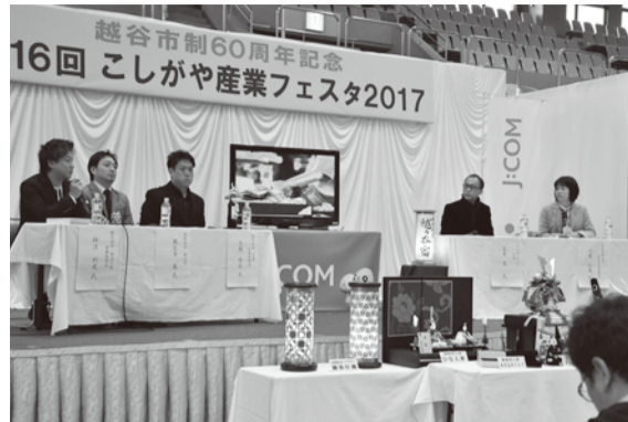
座談会には越谷ひな人形組合青年部の3人とデザイナーらが登壇

また、恒例のこしがや鳴ネギ鍋には今年も長い行列ができていました。座談会には越谷ひな人形組合青年部の3人とデザイナーらが登壇し、「世界に越谷の伝統工芸を広めたい」と将来について熱く語り合う様子が見られました。