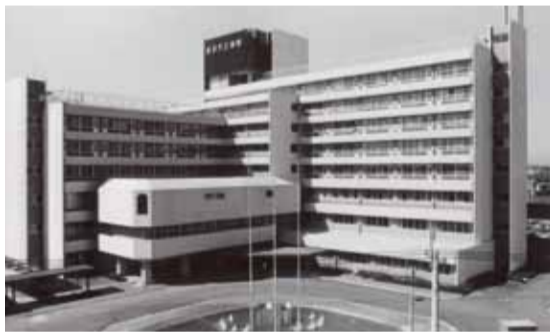
▲市立病院が開院〔昭和51年〕

◆人口急増に伴い進む都市化 (伊原、麦塚、上谷)の越谷町への編入を経て、昭和33年11月に市制が施行され、越谷市が誕生しました。 農地の宅地化や昭和37年の東武鉄道と営団地下鉄(現東京メトロ)日比谷線の北越谷駅までの相互乗り入れなどに伴い、首都圏のベッドタウンとして都市化が進みました。人口は昭和42年には10万人を、昭和46年には15万人を突破し、急激な人口増加に対応するため、街路・公園整備、河川整備など積極的なまちづくりが進められました。また、昭和42年12月の国道4号バイパス(足立区保木間~越谷市下間久里)全線開通や昭和48年4月の武蔵野線開通など交通基盤も整備されました。