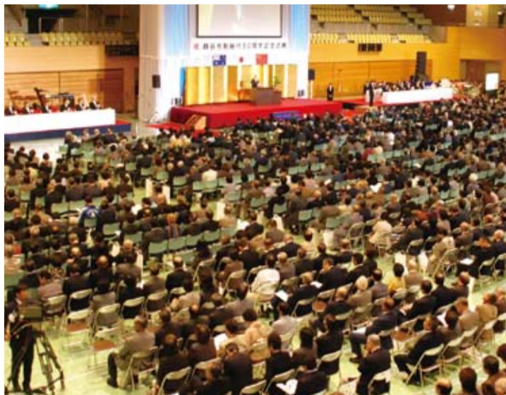
▲越谷市制施行50周年記念式典(平成20年)

11月3日(祝)、総合体育館で、記念式典を開催予定。会場周辺では、市民の皆さんに楽しんでいただけるイベントも実施する予定です。