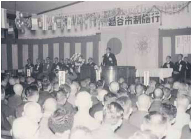
▲越谷市制施行記念式典〔昭和33年〕

◆越谷市の誕生 昭和29年11月に越谷地区2町8カ村(越ヶ谷町、大沢町、桜井村、新方村、増林村、大袋村、荻島村、出羽村、蒲生村、大相模村)が合併して、越谷町となりました。その後、草加町に合併していた旧川柳村の一部