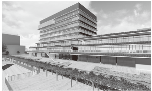
新庁舎外観(イメージ)

案の閲覧と意見用紙の配布は、庁舎管理課とご意見箱設置場所で行うほか、市ホームページから印刷できます。*いただいたご意見への個別回答は行いません。結果は市ホームページ等で公表します。 〈日時・場所〉 ①1月31日(水)：市役所本庁舎5階第一委員会室 ②2月1日(木)：北部市民会館4階ホール ③2月6日(火)：南越谷地区センター多目的ホール。いずれも午後7時から 〈内容〉 越谷市新庁舎