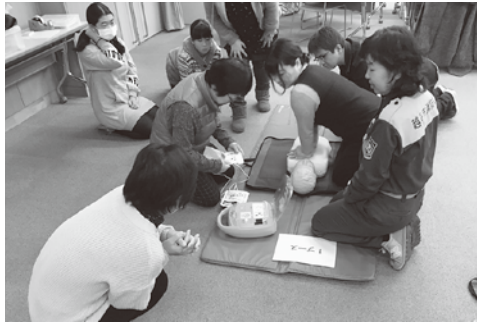
万が一に備えて学びましょう

このようなはがきが届いても、決して相手に連絡せず、支払わずに無視していただき。不安に感じたり対処に困ったりした場合には、消費生活センターへご連絡ください。