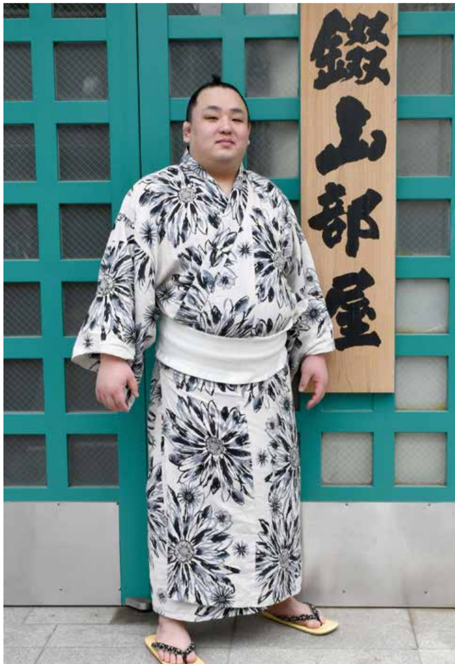
江東区清澄の鍛山部屋にて。しこ名は、埼玉県の愛称「彩の国」にちなみ親方が命名。とても気に入っているとのこと。27歳。身長180cm、体重143kg。