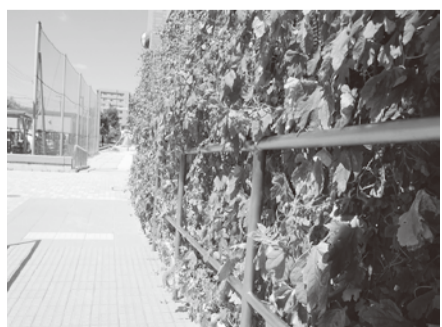
南越谷地区センターの緑のカーテン

市では、平成25年度から緑のカーテンや生け垣・緑の庭、屋敷林などの優れた取り組みを「しががや緑のオアシス」として認定しています。講習会参加者には、ゴーヤの苗(1人につき3株)を無料で提供します。時5月17日(金)、午後2時～3時30分 関中央市民会館5階第2・3会議室 関専門家による講義、質疑応答、ゴーヤ苗の配布 関自宅の庭やベランダで緑のカーテンを育て、「緑のオアシス」として応募いただける方30人(定員になりしだい終了)。