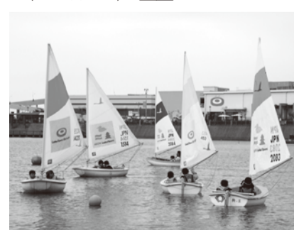
大相模調節池でヨットに乗ろう!

▶遊んで、学んで、エコレンジャー 時7月15日(祝)、午前8時30分~午後1時。雨天延期8月12日(休) 場大相模調節池 内自然環境観察、ヨット・カヌー体験 同小学5年生~中学生 費500円(保険料含む) 申問NPO法人セイラ