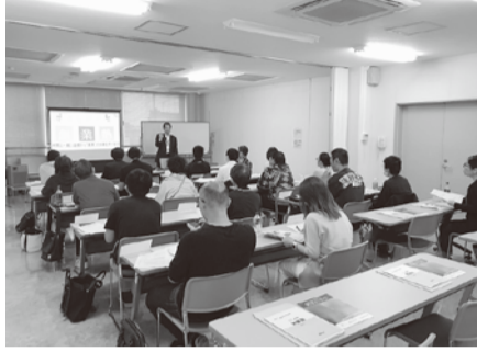
しがや創業塾の様子

◆創業支援セミナー令和元年度版しがや創業塾(土曜コース) 時間①9月7日(土) ②9月14日(土)