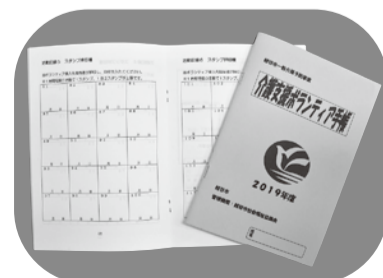
介護支援ボランティア手帳

問地域包括ケア推進課 ☎963-9187、越谷市社会福祉協議会 ☎966-3211