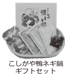
こしがや鴨ネギ鍋ギフトセット