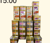
漬け物各種 1,350円から/9kg