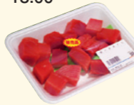
マグロぶつ切り 540円/1パック