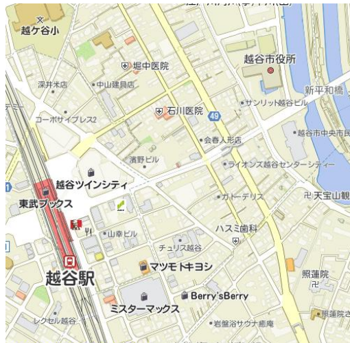
越谷市庁舎位置図