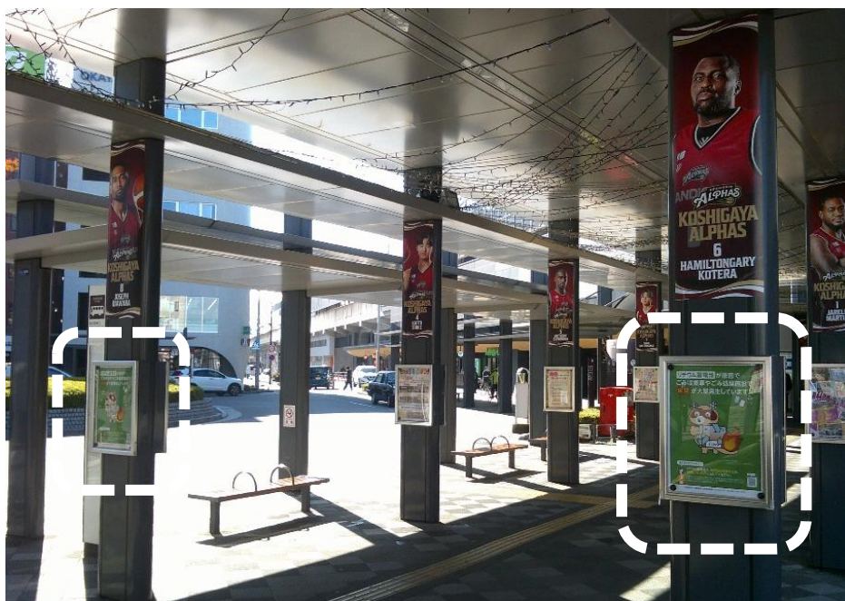
越谷駅東口ロータリーポスター掲示の様子