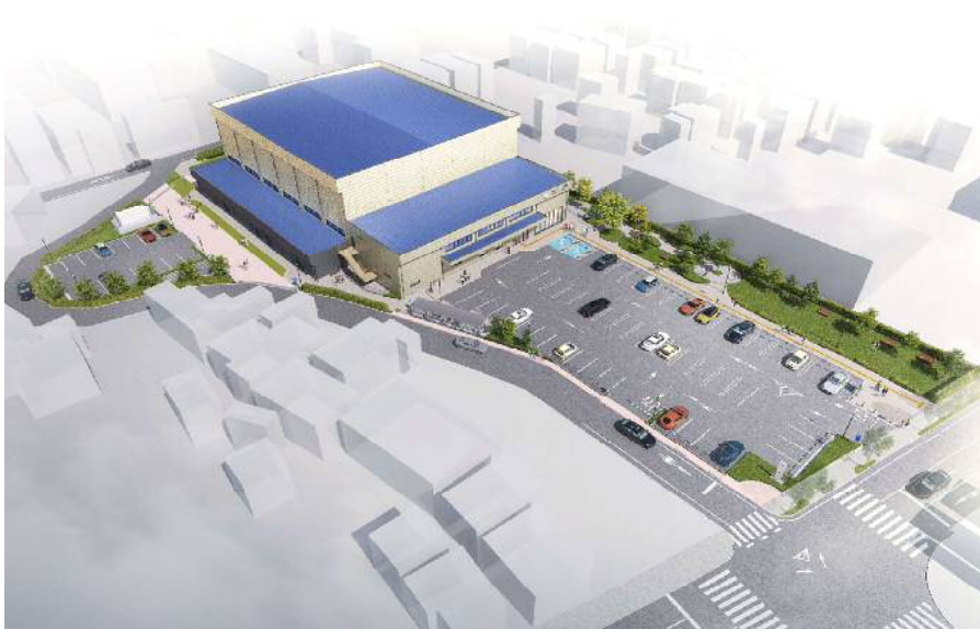
(仮称) 越谷市立地域スポーツセンター パース図