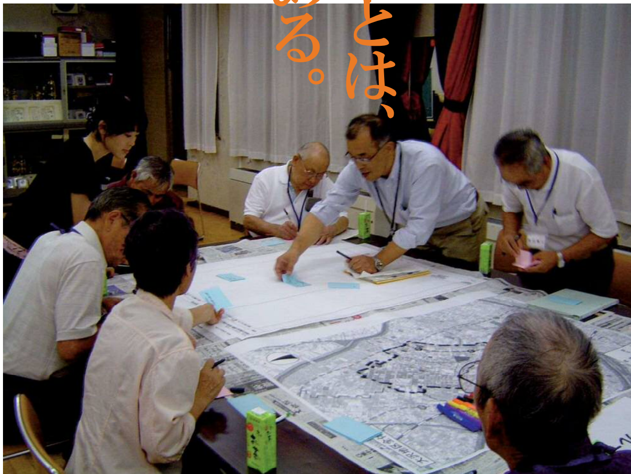
【第4次総合振興計画前期基本計画 地区まちづくり会議の様子】