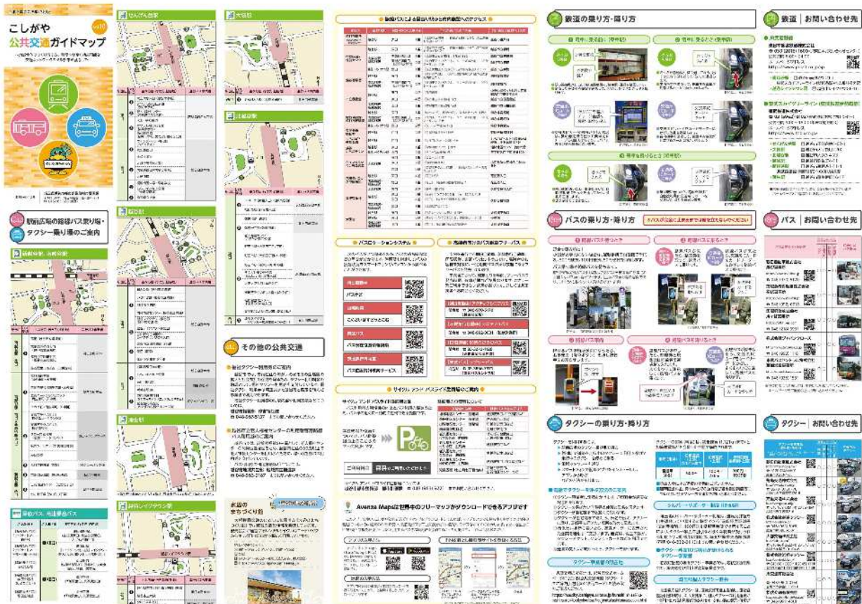
◆公共交通ガイドマップ 記事面