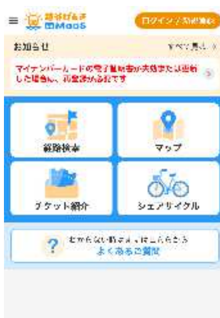
MaaS アプリ(TOP 画面)

○鉄道・バス・タクシー・シェアサイクルを含めた経路検索機能や、バス・タクシーの割引機能等を有した MaaS アプリ「越谷げんき de MaaS」を導入