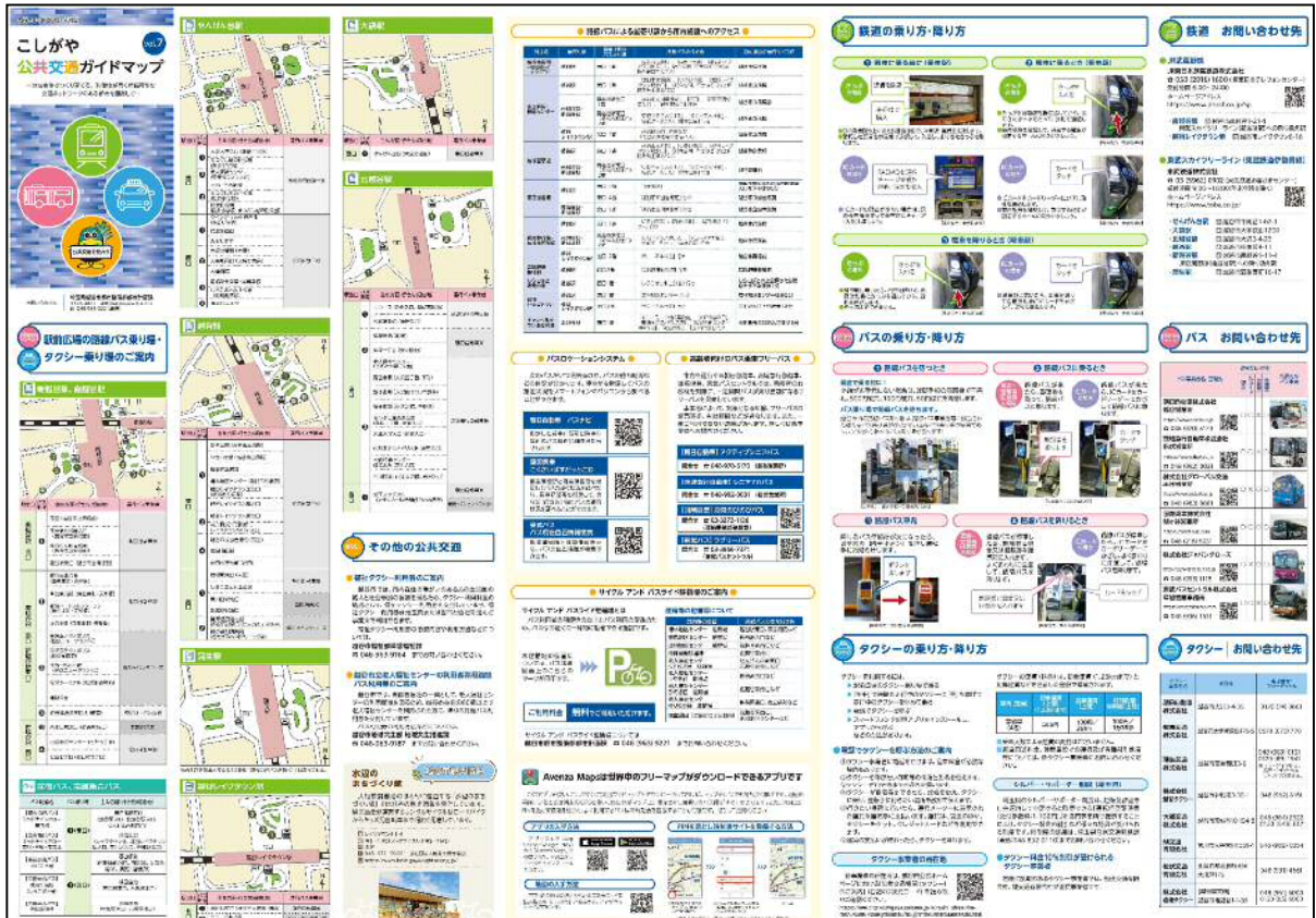
◆公共交通ガイドマップ 記事面