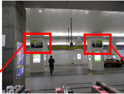
写真：越谷駅改札正面に設置