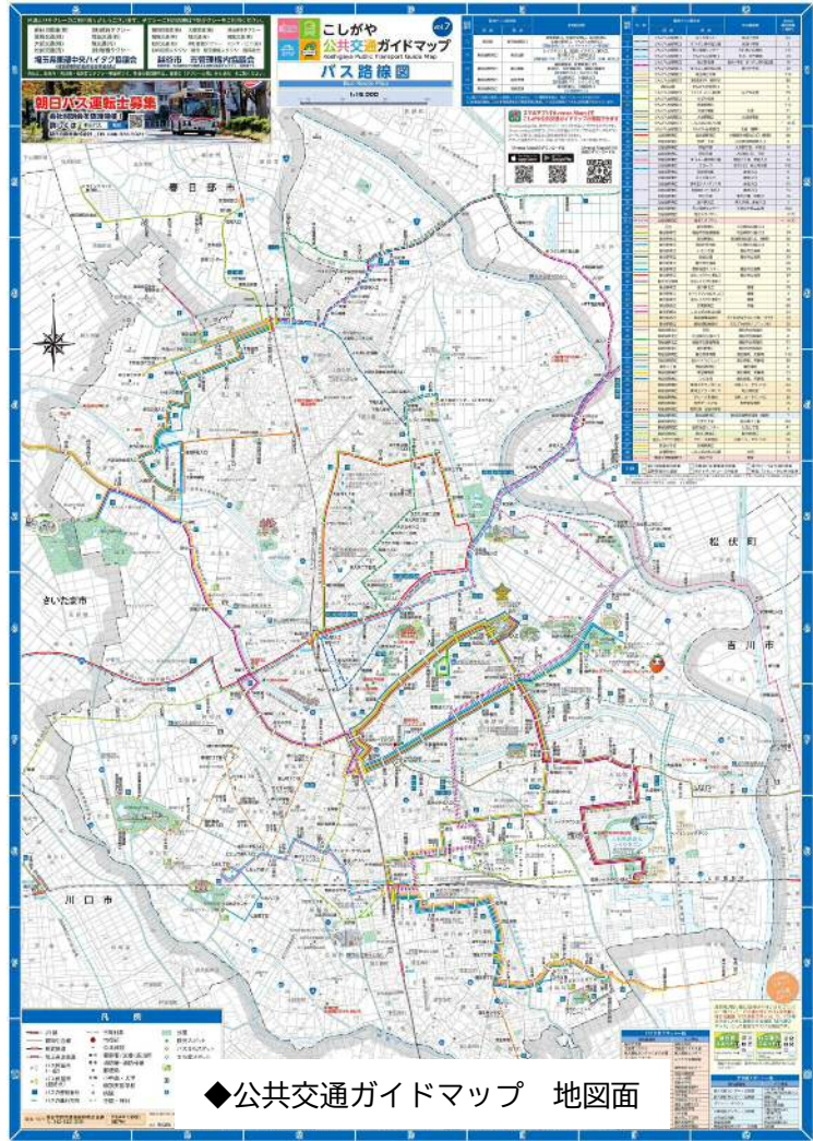
◆公共交通ガイドマップ 地図面