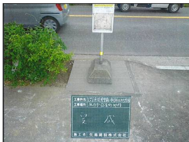
写真：工事後のバス停の状況

バス停に隣接する土地の開発に伴い、バス停の利用環境に支障が生じないように、歩道の植栽を一部撤去してバス停を移設した。