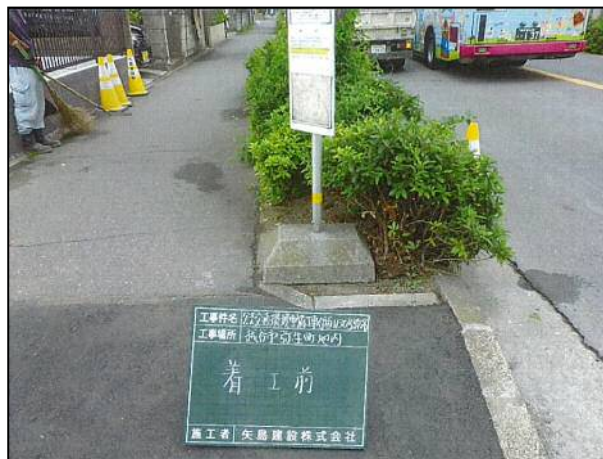
写真：工事前のバス停の状況

バス停に隣接する土地の開発に伴い、バス停の利用環境に支障が生じないように、歩道の植栽を一部撤去してバス停を移設した。