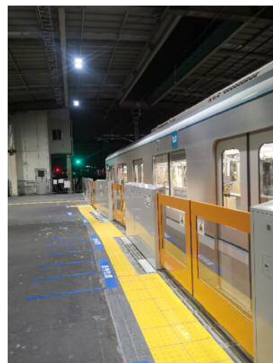
写真：ホームドア完成後 (越谷駅上り緩行線ホーム(3番線))