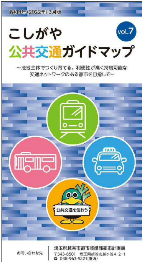
◆公共交通ガイドマップ 表紙