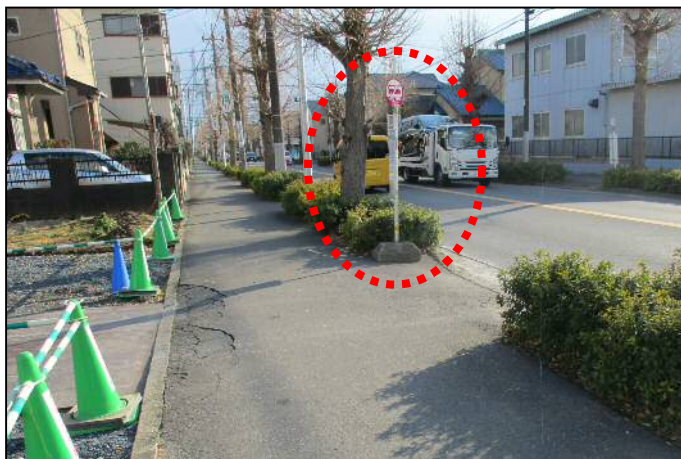
写真：工事前のバス停の状況