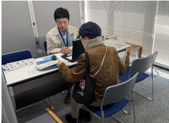
登録支援会の様子