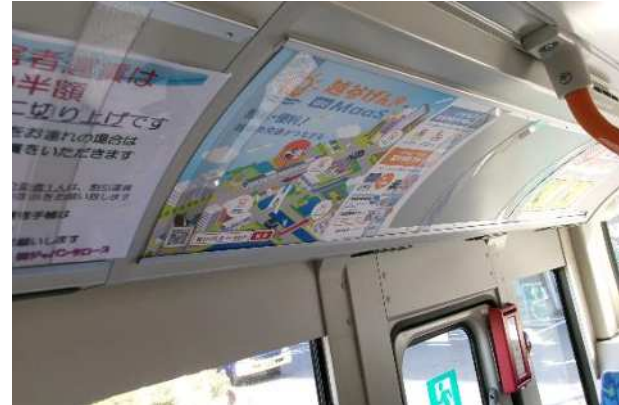
タクシーのシール、バスの車内広告