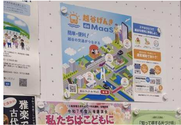
地区センター等へのポスター、パンフレットの設置