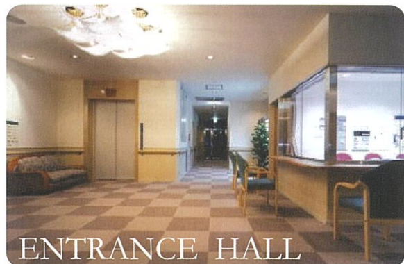
▲エントランスホールには管理事務室、相談室、エレベーター、郵便受け等があり、施設の中核機能が集中しています。