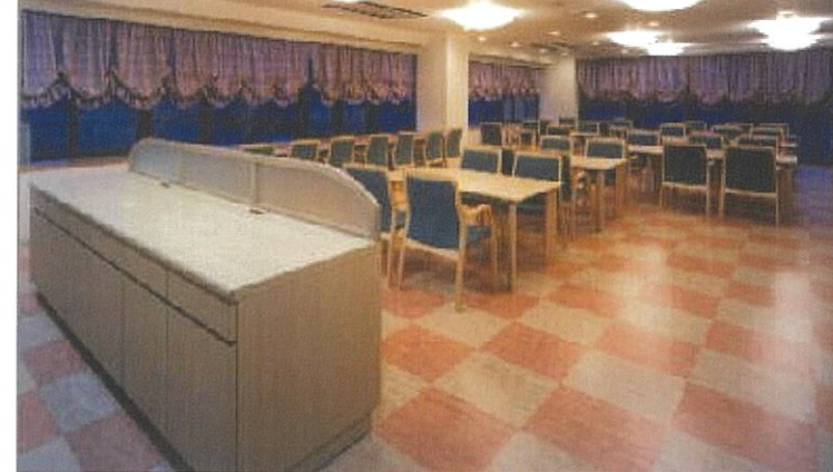
▲毎日のお食事はこの大食堂でお召上がりいただけます。

▲居室は全51室。全て南東・南西向きで日当たり良好です。 1人用居室: 21.67㎡~22.33㎡(47室) 2人用居室: 34.79㎡(4室)