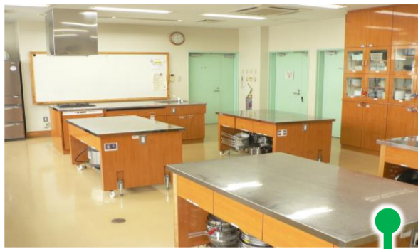
No.8: 調理室 昇降式調理台を備えています。