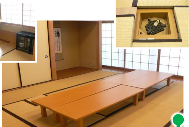
No.6: 和室1 茶道の炉を備えています。「和室2」と引き戸で間仕切りされており、一体的に使用できます。