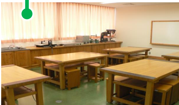
No.5: 工作工芸室 陶芸窯を備えています。