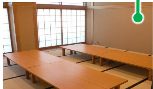
No.7: 和室2 「和室1」と引き戸で間仕切りされており、一体的に使用できます。