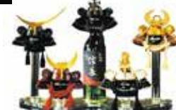
サムライ ボトル 兜