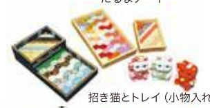
招き猫とトレイ（小物入れ）